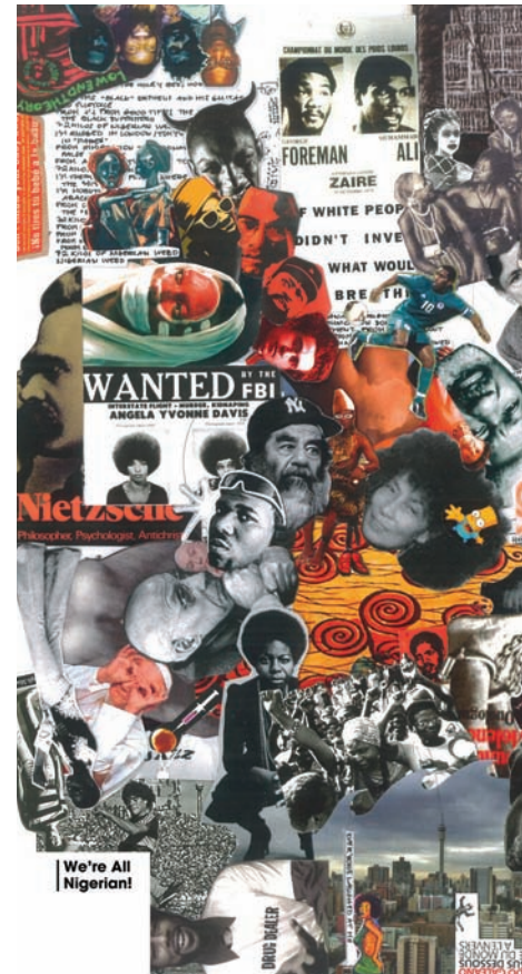
Détail de la couverture : Chimurenga 8: Nous sommes tous nigériens